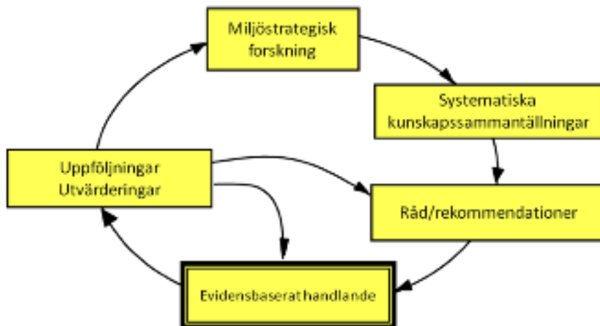
Figur. Samspelet mellan forskning och evidensbaserat handlande

Det föreslagna rådet ska i första hand använda ett evidensbaserat arbetsätt. Figuren ovan visar strategin för evidensbaserad praktik. Centralt är att tillgängliga forskningsresultat sammanställs på ett systematiskt och transparent sätt. De riktlinjer och rekommendationer som utfärdas av myndigheter, företag och organisationer bygger på dessa systematiska kunskapssammanställningar och påverkar praktiken, som alltså på så sätt blir evidensbaserad.